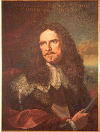
Portrait de Turenne

S'étant toujours refusé à une conversion opportuniste, il ne franchira le pas qu'en 1668, en petit comité. C'est l'aboutissement d'une longue démarche personnelle.