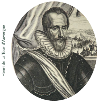
Henri de La Tour d'Auvergne

Compagnon d'armes d'Henri de Navarre et converti au protestantisme, il épousa en