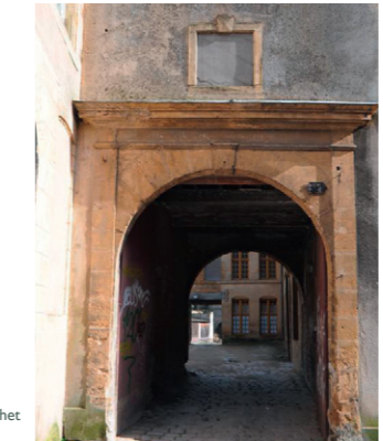
Porche rue Berchet

Ce porche donnait autrefois accès à l'Académie des Exercices, école militaire fondée en 1607 par Henri de La Tour d'Auvergne. On y apprenait la théorie de la guerre et le maniement des armes. Après la fermeture de l'Académie