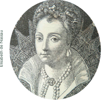
Elisabeth de Nassau

Seconde épouse d'Henri de La Tour d'Auvergne, Elisabeth de Nassau, née en 1577, était la fille de Guillaume d'Orange-Nassau, fondateur de la république des Provinces-Unies.