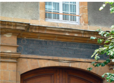
Hôpital de Sedan

Une plaque de marbre noir est apposée au-dessus de l'entrée située à gauche de la chapelle. Elle porte l'inscription "Pavillon Turenne", suivie d'un texte en latin qui rappelle la générosité de Turenne puis de Rovigo en faveur de l'hôpital.